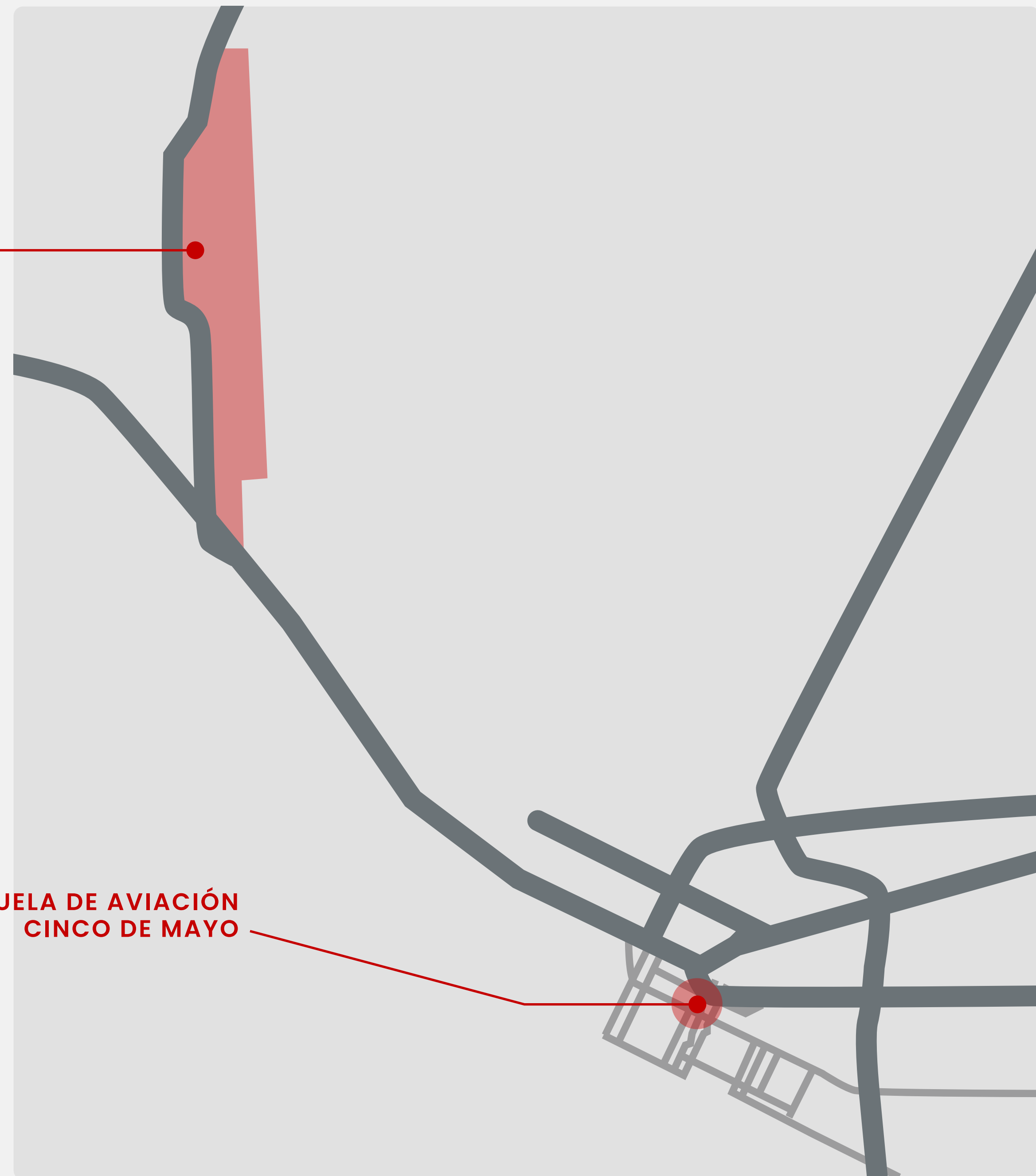
ESCUELA DE AVIACIÓN CINCO DE MAYO