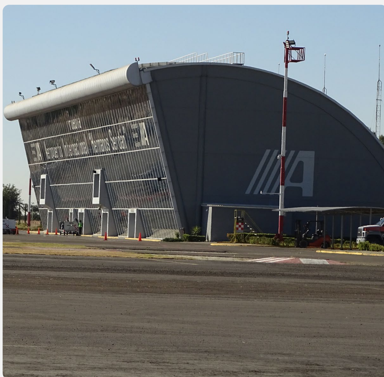
AEROPUERTO INTERNACIONAL "HERMANOS SERDÁN"

Ubicación estratégica para facilitar el traslado a nuestros estudiantes que deben cumplir con horas de vuelo.